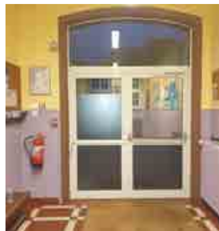
Film opaque sur les fenêtres de l'école