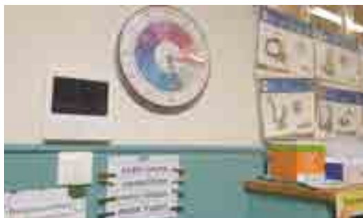
Visiophone école élémentaire