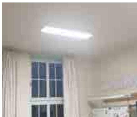
Eclairage LED classe école élémentaire