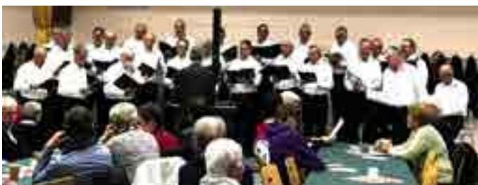
Concert à Meissenheim

Et comme un cadeau, nous avons terminé l'année avec notre concert de Noël, à Sessenheim, un moment