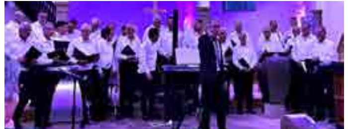
Fête paroissiale de Roppenheim

magique où les voix se mêlent aux lumières hivernales et où le chant rassemble les familles, les amis et toute la communauté dans un esprit de fête et de sérénité.